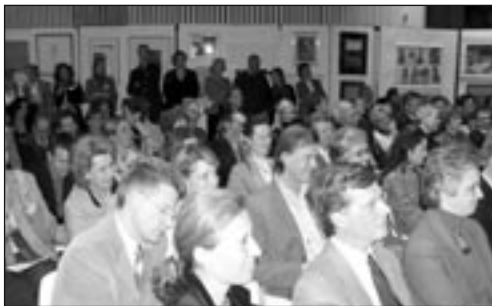
Kunstauction im Kunsthaus Graz zugunsten des ICEP Job-Creation-Projekts für Frauen in den Slums von Nairobi