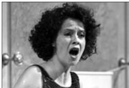
Angelika Kirchschrager fühlte sich wohl im prachtvollen Rahmen des Hauses der Industrie und vor dem großen Fan-Publikum.