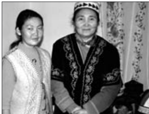
Vor allem jüngere Frauen in Zentralasien sehen sich danach, ihre Gesellschaft stärker mitzugestalten.

Partner-NGO: KFSCED, Kasachstan Projektkosten: € 85.743,- Finanzierung: ICEP: € 21.436,- ADA: € 64.307,- Projektdauer: Jan 2005 – Dez 2006